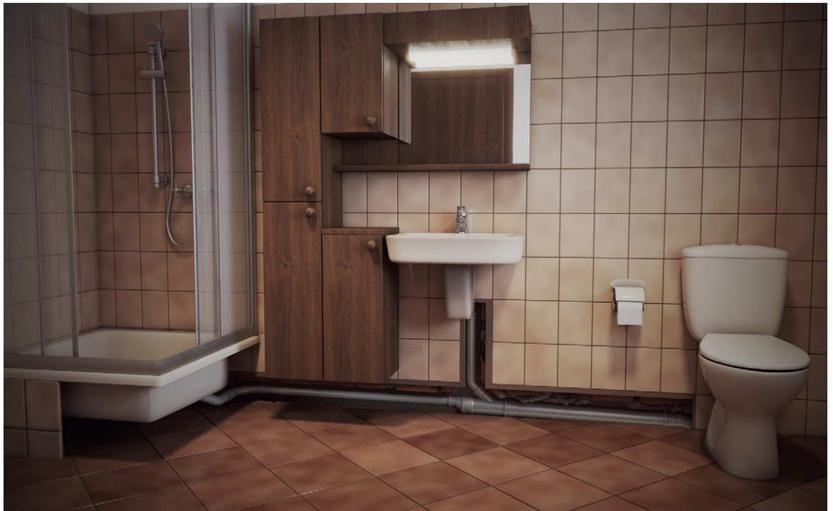
Das in die Jahre gekommene Bad mit erhöhter Duschwanne. Im Untergrund sichtbar gemacht der Verlauf der alten Abwasserleitung (grau).

Eine Badmodernisierung im Gebäudebestand ist häufig mit viel Aufwand verbunden. In manchen Fällen scheint eine bodengleiche Dusche mit Duschrinne nicht möglich zu sein. Eine barrierefreie Ausführung scheitert immer wieder am fehlenden Gefälle für das ablaufende Duschwasser. Oft liegt das vorhandene Abwasserrohr höher als der geplante Bodenablauf und der Anschluss an die Fallleitung zu hoch in der Wand.