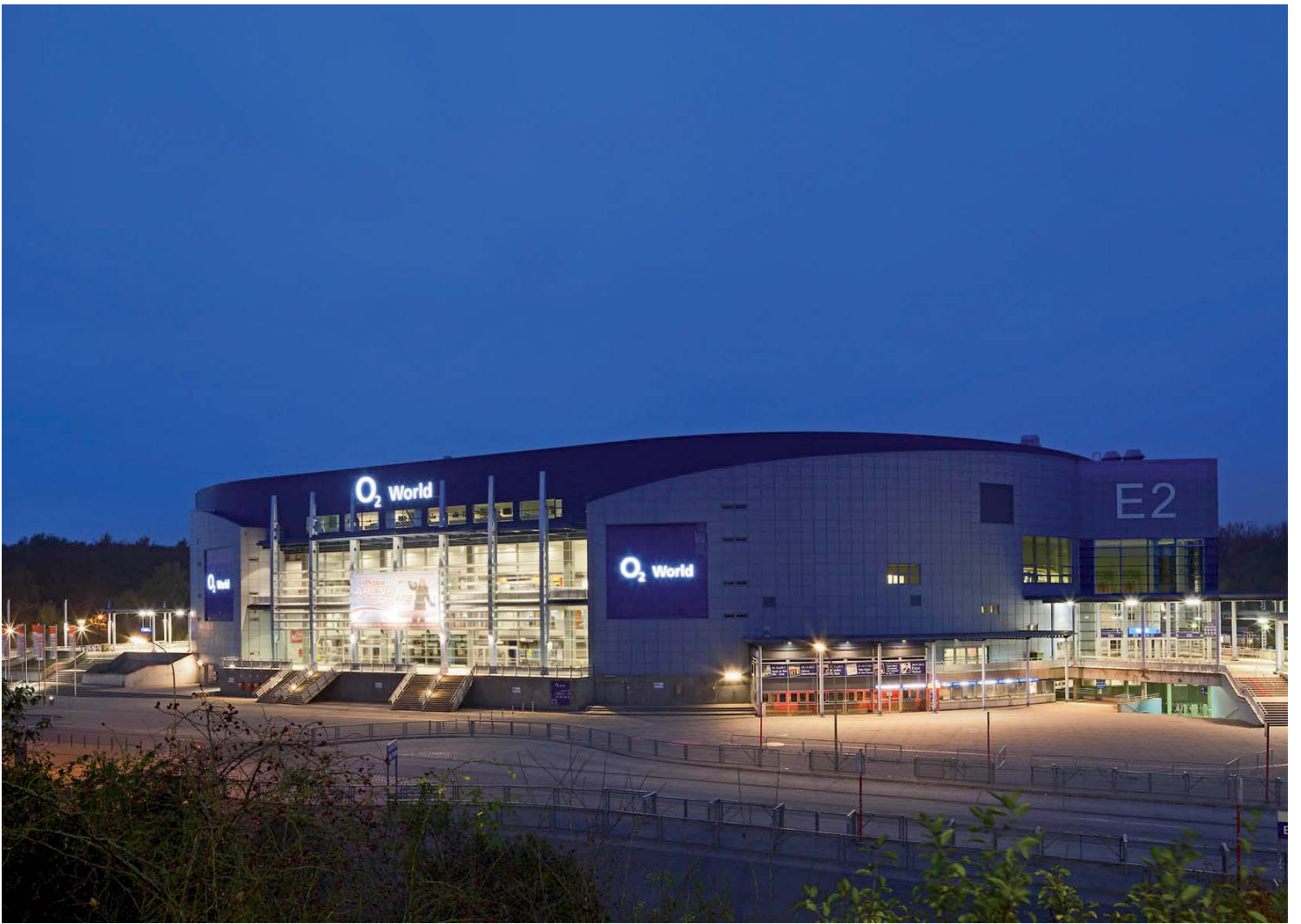
Fotografie Pressefotos O 2 World Hamburg